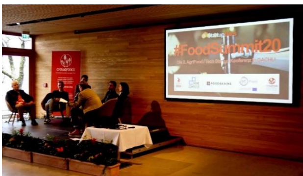
AgriFood Startups treffen sich zum 2. #FoodSummit20 am Bodensee

Am 27. Februar 2020 trafen sich rund 200 Vertreter von Start-Ups, Investoren, Handel und etablierten Unternehmen der Agrar- und Lebensmittelwirtschaft aus vier Ländern zur zweiten „StartupBites #FoodSummit“ Start-Up-Konferenz auf der Insel Mainau. Die Start-Up-Konferenz des ersten internationalen AgriFood Start-Up Verbandes „crowdfoods“ mit Sitz in Kreuzlingen am Bodensee hat sich mittlerweile als festes Event in der AgriFood Start-Up Szene etabliert. Auf der Veranstaltung treffen sich jährlich Vertreter der Agrar- und Lebensmittelwirtschaft aus Deutschland, Österreich, der Schweiz und Liechtenstein. Prof. Dr. Andrea Maier-Nöth und Andreas ter Woort stellten dort den Sigmaringer InnoCamp vor.