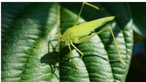
Insekten sollen helfen Abfallströme abzubauen

Im Projekt RECOVER, das durch die Europäische Kommission gefördert wird, werden neue biotechnologische Lösungen entwickelt, bei denen Mikroorganismen, neuartige Enzyme, Würmer und Insekten verwendet werden, um Abfallströme aus herkömmlichen Kunststoffverpackungen und Agrarkunststoffen abzubauen.