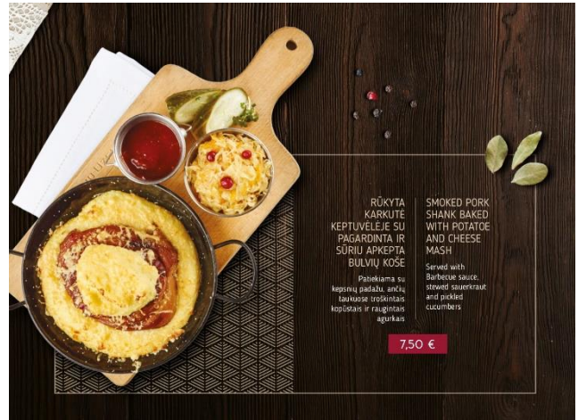
Landestypische Spezialität: Überbackene Schweinshaxe mit Kartoffelpüree und Sauerkraut

Trotz der zahlreichen Gespräche blieb auch etwas Zeit für Sightseeing und den Genuss litauischer Spezialitäten in einem traditionellen Gasthaus. Sollte es die aktuelle Situation ermöglichen, wird Prof. Dr. Heindl Ende September Gastvorlesungen im Modul Food Quality and Safety Management des Masterstudiengangs Food Science and Safety an der KTU halten.