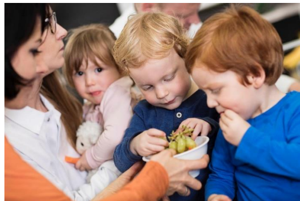
Erfolgreiche Kochprogramme für Kinder können die Einstellung gegenüber gesunder Ernährung verbessern.

Erfolgreiche Kochprogramme machen aus dem gemeinsamen Kochen ein positives Erlebnis, bieten Freiraum für selbständiges Arbeiten, beziehen gleichaltrige Kinder und Vorbilder (ältere Geschwister, Lehrer*innen, Köch*innen etc.) sowie Eltern mit ein. Die Kombination mit gärtnerischen Tätigkeiten steigert zudem die Bereitschaft der Kinder, die angebauten Lebensmittel zu probieren.