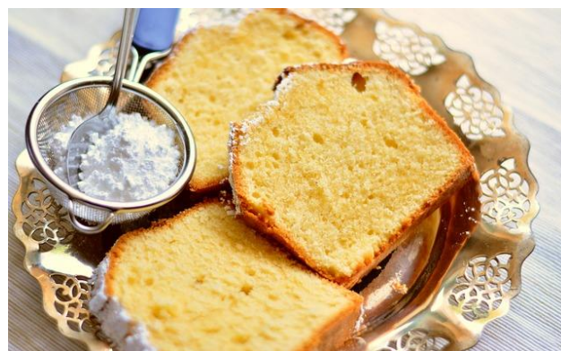
Klassischer Sandkuchen – der Zuckeranteil lässt sich sehr gut reduzieren

Das bedeutet für Verbraucher*innen, dass bei Standardrezepten die Zuckermenge einfach um 30 Prozent reduziert werden kann.