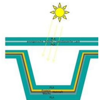
Angestrebter Verbundaufbau im Projekt PLA4MAP

aufgrund eines Beschlusses des Deutschen Bundestages