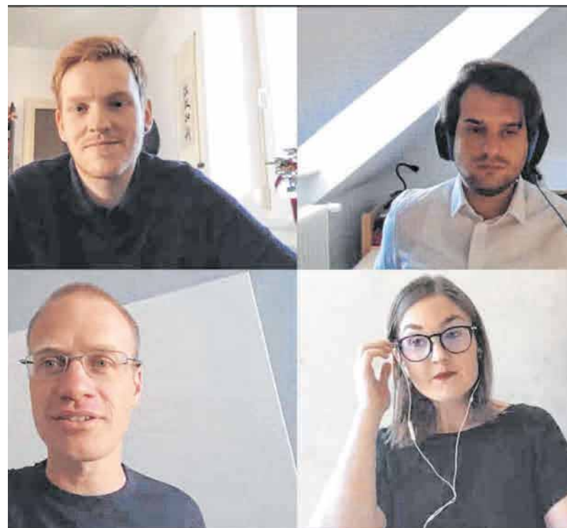
Bei der digitalen Exkursion schalten sich die Teilnehmer online zusammen, um die Technologiewerkstatt kennenzulernen.

150 Studenten nehmen an erster Online-Exkursion der Hochschule Albstadt-Sigmaringen teil