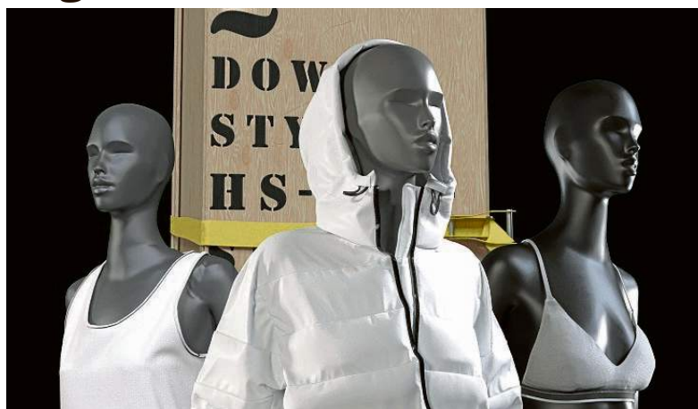
Sieht nur aus wie ein Foto: Studierende arbeiten mit 3D-Programmen an einer fotorealistischen Visualisierung.