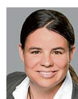
Prof. Manuela Bräuning.

ve Bekleidungs-systeme an die Hochschule berufen. Mit smarten Textilien beschäftigt sie sich bereits seit längerer Zeit: So trug