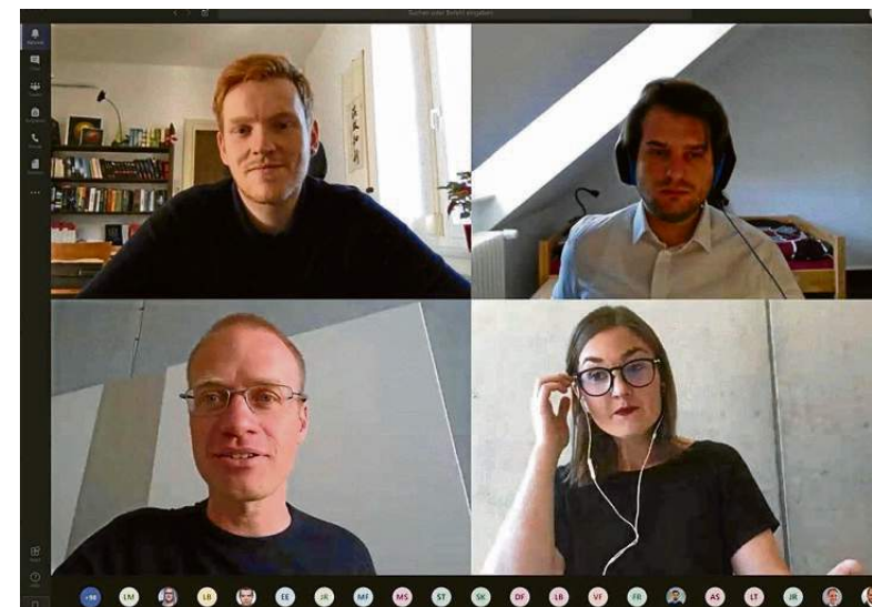
Virtueller Austausch: Bei der digitalen Exkursion schalten sich die Teilnehmer online zusammen.