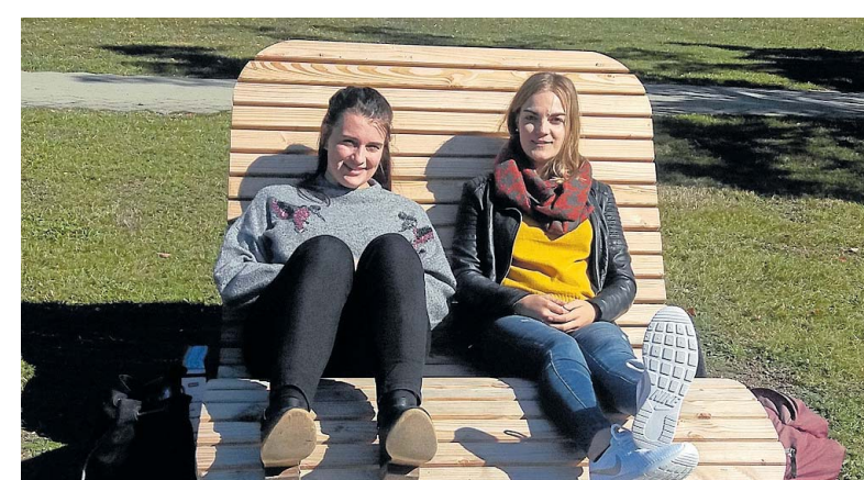
Zwei Studierende der Hochschule haben es sich auf einer der fünf Albliegen bequem gemacht.