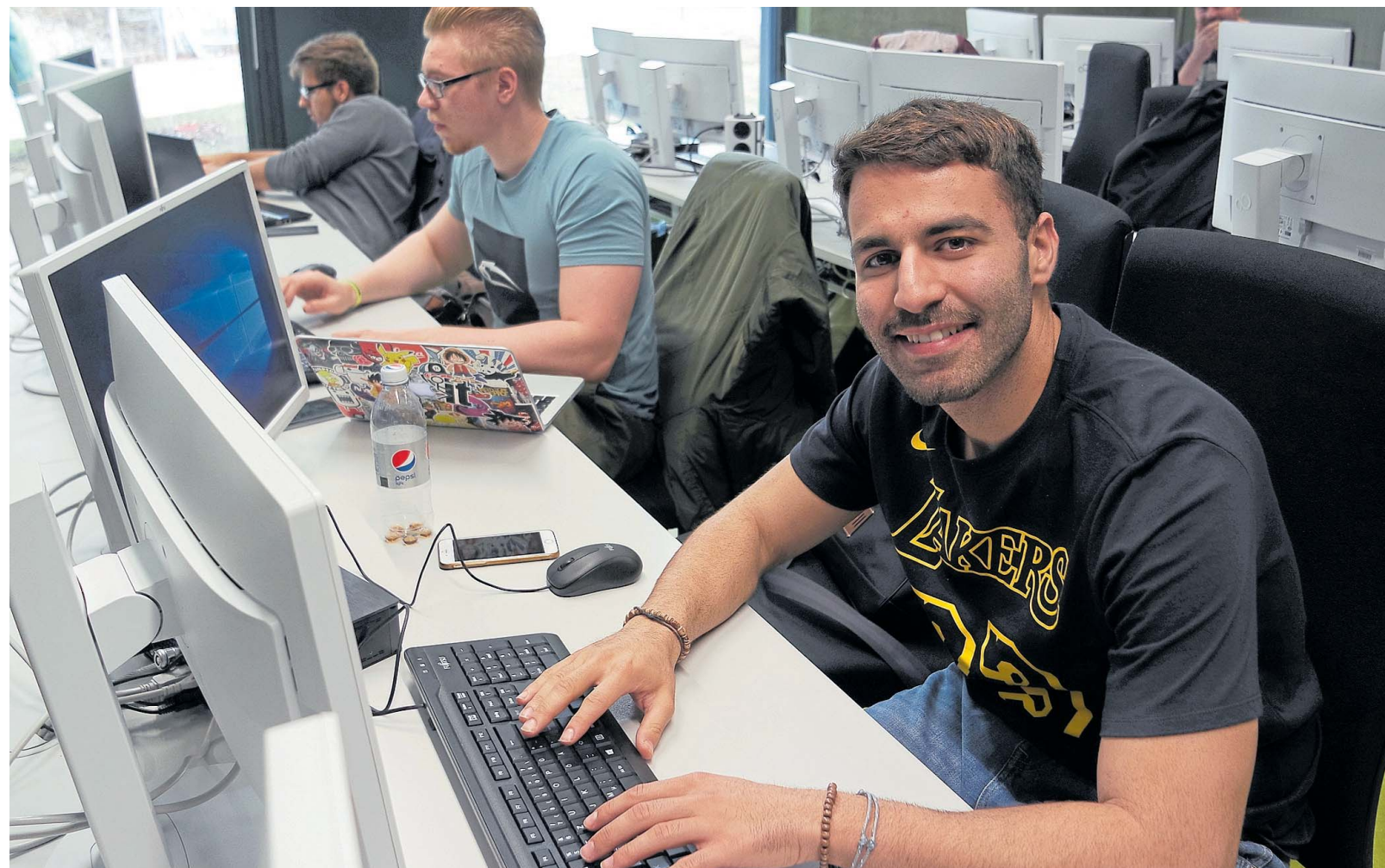
So macht Studieren Spaß: Die IT-Räume im neuen Hochschulgebäude sind mit modernsten Rechnern ausgestattet.